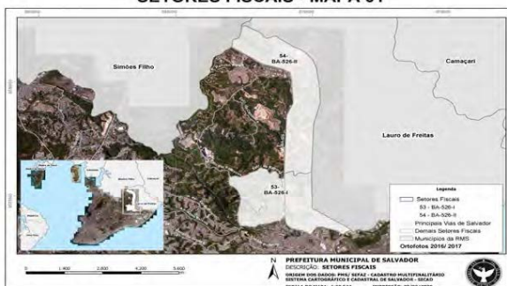
MAPA DOS SETORES FISCAIS BA 526 I E BA 526 II SETORES FISCAIS - MAPA 01